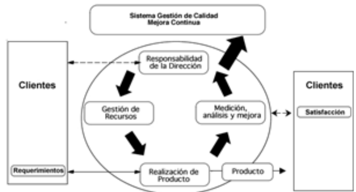
Figura 3. Proceso de Calidad ISO 9000.

En este sentido, si bien son normas enfocadas a garantizar principalmente la calidad de los procesos de producción, su aplicación al campo del software no sólo resulta posible sino conveniente, ya que permite garantizar unos adecuados niveles de calidad en la etapa del proceso de producción, a la vez que permite monitorear -y mejorar- dichos procesos.