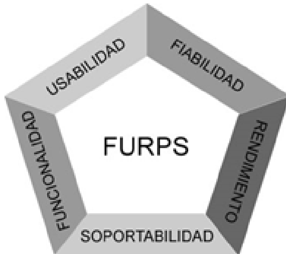
Figura 1. Modelo de Métrica FURPS.