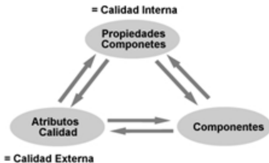
Figura 2. Modelo de Métrica Dromey

Se podría decir que la principal fortaleza de este modelo es al mismo tiempo su principal debilidad: la excesiva flexibilidad. Si bien facilita la evaluación de muy diferentes tipos de productos de software exige a su vez un mayor compromiso de parte del programador a la hora de evaluar, ya que debe ser él quien determine los atributos que serán tomados en cuenta.